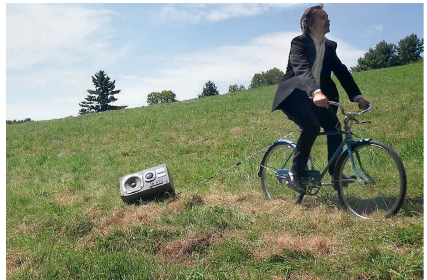
Pferde über Wiese, 2013. 1-Kanal Video, HD, 1'30", mit Ton, endlos geloopt