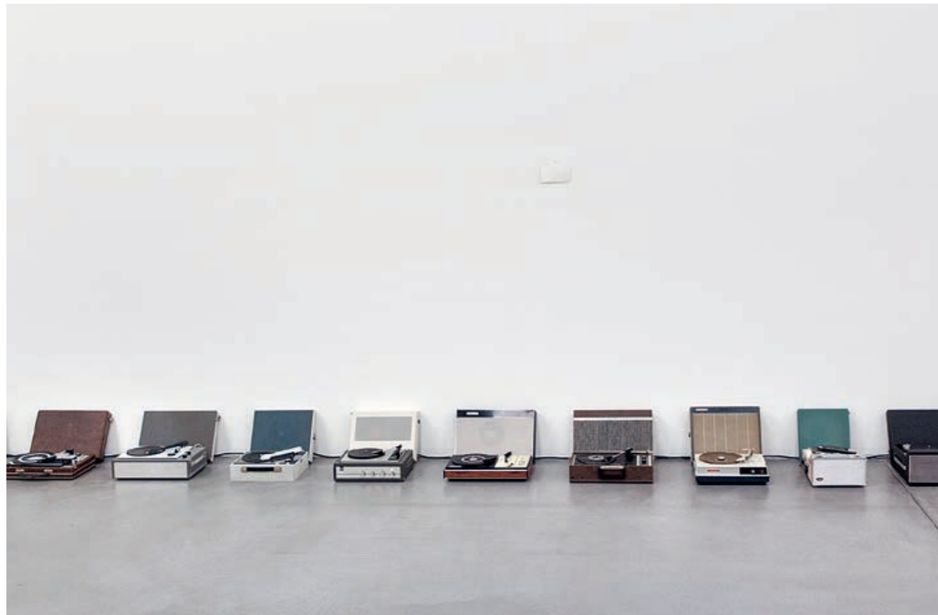
... weil sie das Ende nicht an den Anfang zu knüpfen vermögen, 2018, Audioinstallation mit verschiedenen Kofferplattenspielern, Postkarte gepinnt, ca. 9 m lang, Ausstellungsansicht Haus Konstruktiv, Zürich

Anhand der ortsspezifischen Installation «Apedromo» für die Art Safiental 2018 wird der Einfallsreichtum deutlich, mit dem Halter & Marchisella visuelle und akustische Erfahrungen in ein räumliches Setting einbinden. Zunächst fasziniert die Architektur des ovalen Wasserbeckens am Talende in Wanna. Bei näherer Erkundung der Situation gesellt sich ein Hörerlebnis hinzu, und zwar das Summen unzähliger Bienen, das wie ein Surround-Sound um das Reservoir läuft; es scheint den Bienenkästen am oberen Ende der Anlage zu entspringen, kommt aber eindeutig aus den vier Lautsprechern am Beckenrand. Halter & Marchisella appellieren hier an die Bereitschaft, Sehen und Hören in der Schwebelage zu halten. Denn je nach Standort und Windrichtung schwillt der Sound an oder ab, und dementsprechend verschieben sich die «Bilder»: In der Nähe der Bienenhäuser fügen sich Insekten, Gehäuse und Ge-