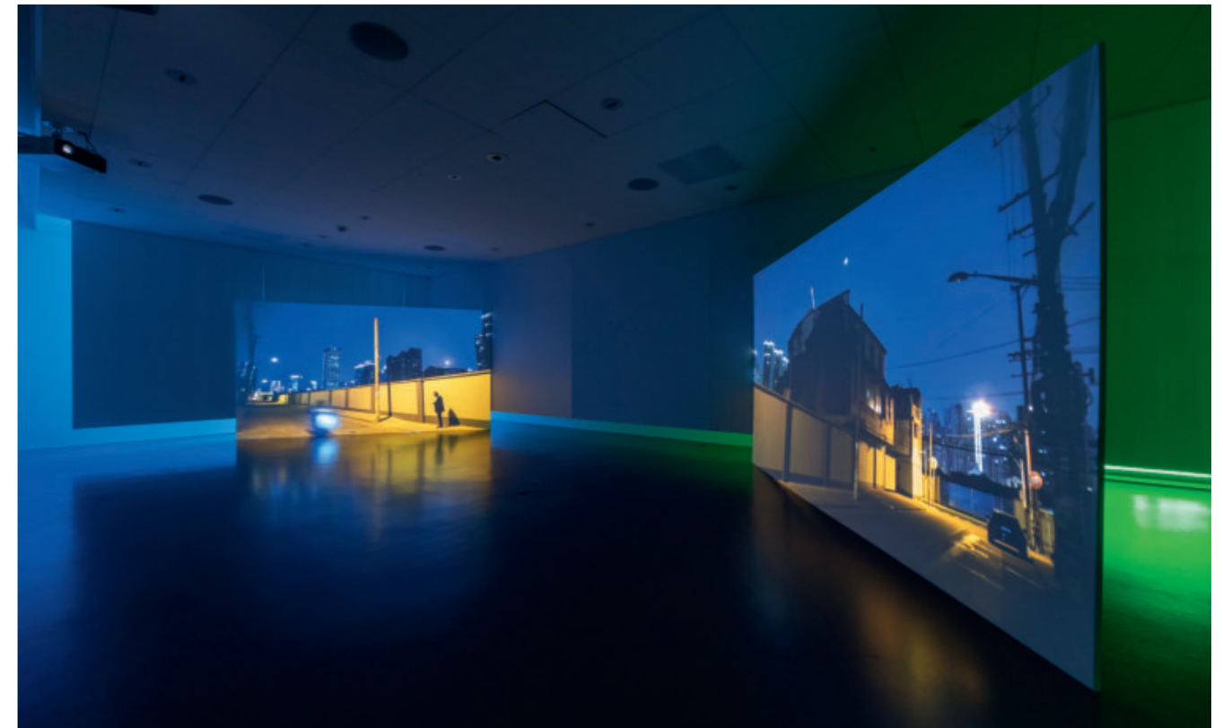
Marianne Halter & Mario Marchisella · You are my Ghost, 2021, 2-Kanal-Videoinstallation, Sound, Ausstellungsansicht Haus für Kunst Uri, Altdorf.

→ «Marianne Halter & Mario Marchisella – Bühnen, Brachen und zwei Plattenspieler», Haus für Kunst Uri, bis 19.11. ↗ hausfuerkunsturi.ch