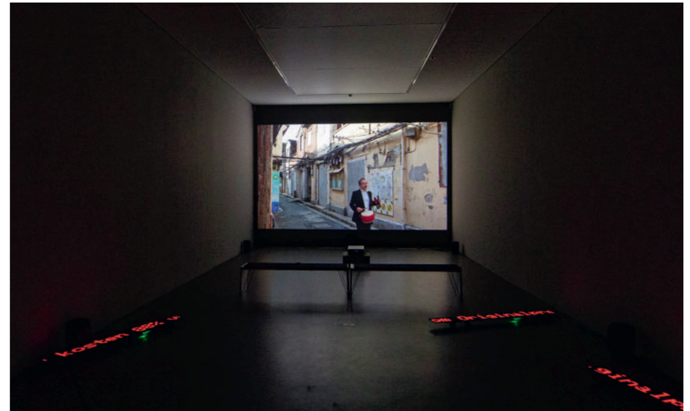
Marianne Halter & Mario Marchisella · Old Town New Town, 2023, 3-teilige Rauminstallation mit Videoprojektion, Ausstellungsansicht Haus für Kunst Uri, Altdorf.