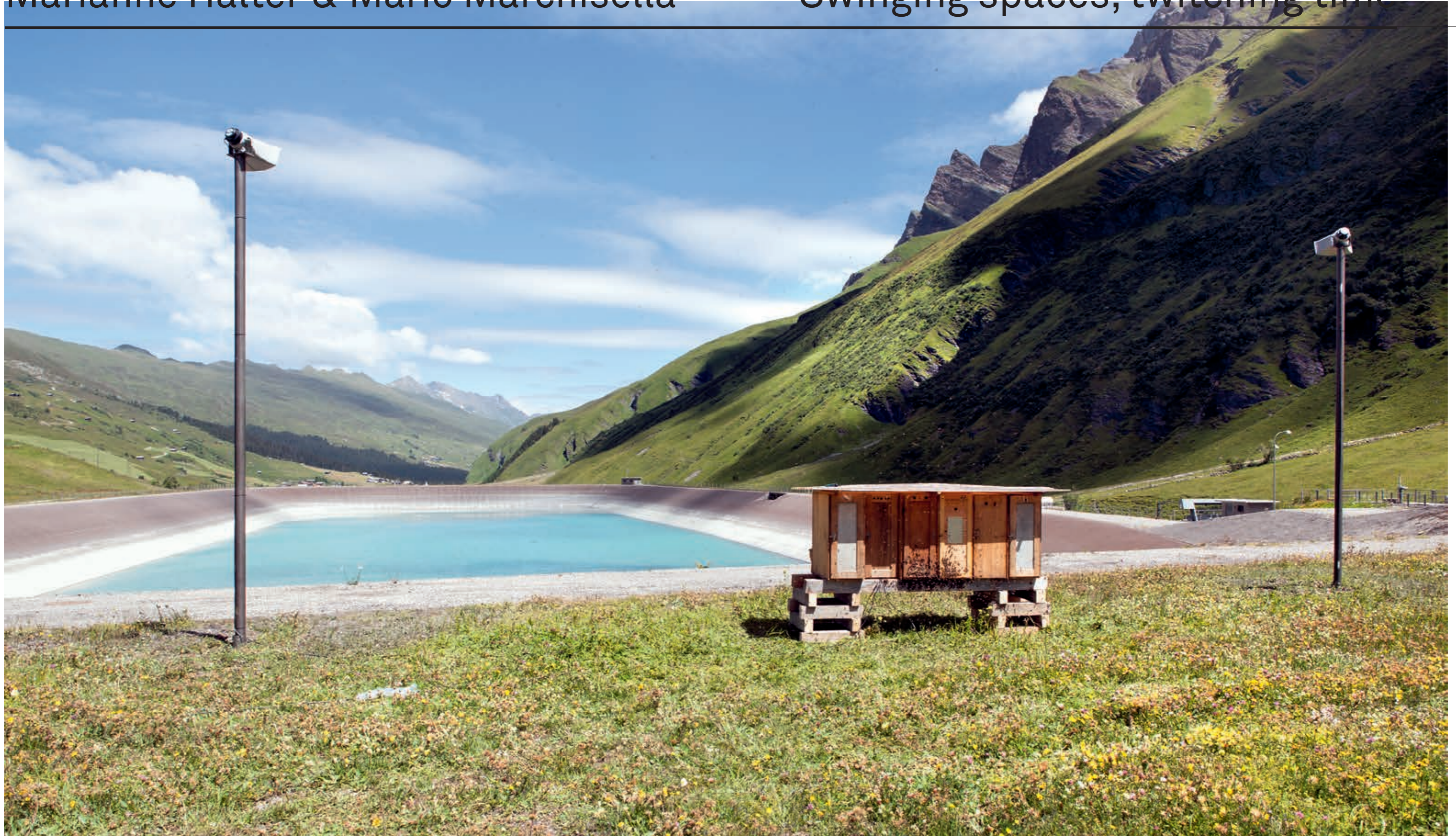
Apedromo, 2018, dynamische Audioinstallation mit Bienenbeuten und Bienenvölkern, 4 Stadion-lautsprecher und 1 Zielflagge, ca. 350x120 m, Art Safiental 2018