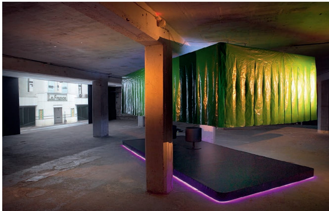
Rest or Stay, 2019, Installation mit begehbare Bühne, Neonschrift, Videoprojektion und Video auf Monitor, mit Ton, Ausstellungsansichten Kunstraum Kreuzlingen

summe zur logischen Einheit; mit Abstand, v. a. mit Blick auf die Zielflagge, gewinnt die markante Beckenform an Dominanz und wird zum Motodrom, in dem man plötzlich einem unsichtbaren Autorennen beiwohnt.